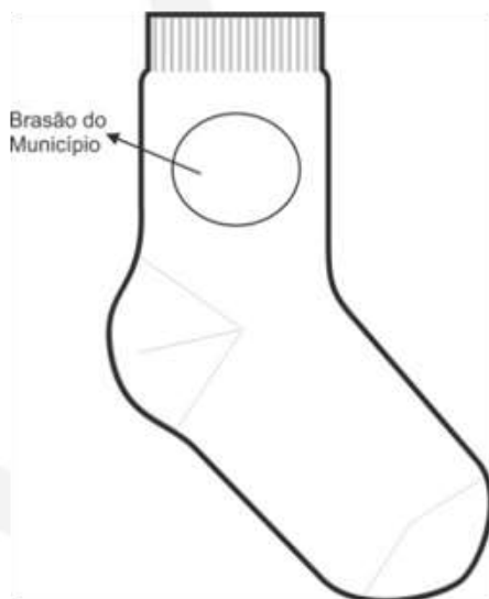
ILUSTRAÇÃO DO PRODUTO